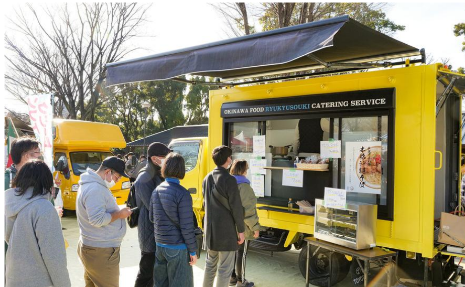
キッチンカー出店