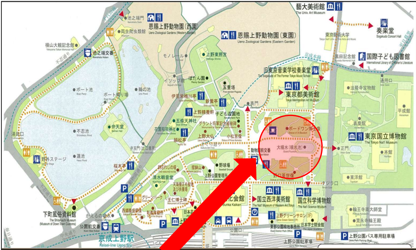
上野恩賜公園 噴水広場